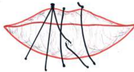
Immagine: Francesco Polissano.